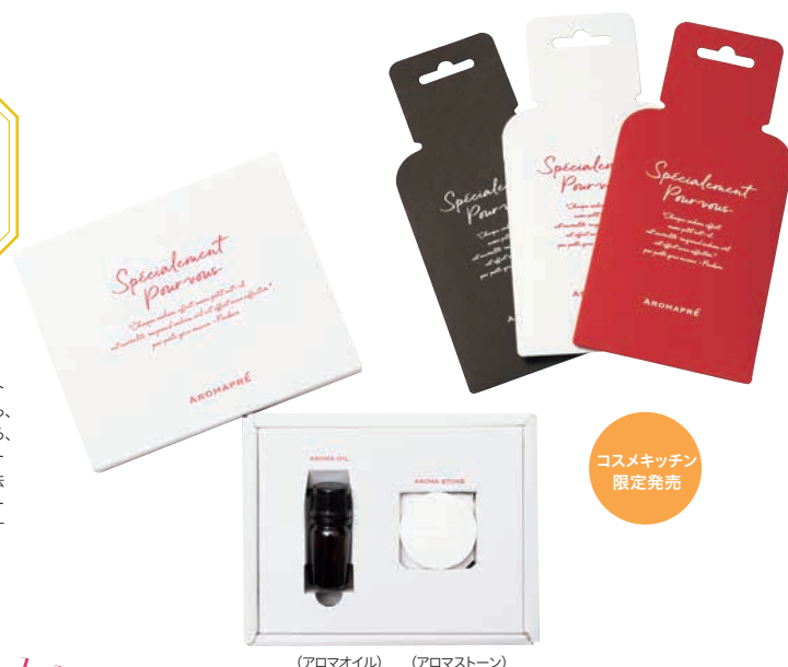
(アロマオイル) (アロマストーン)