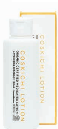
薬用オーガニック認証 ローション