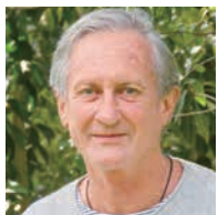
Himalayan Flower Enhancers タンマヤ

自然や地球とのつながりを感じることで、自分自身とつながり安心感に包まれた時、あなたはあなた本来の美しい調和のとれたハーモニーを奏でます。 あなたの調和は、水面にひろがる波紋のように、あらゆる生命・地球全体の調和へとつながっています。