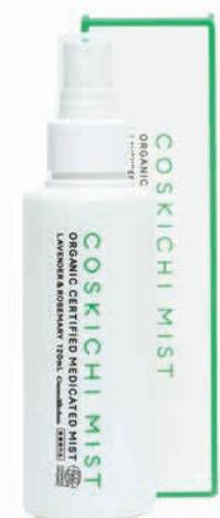
薬用オーガニック認証 ミスト