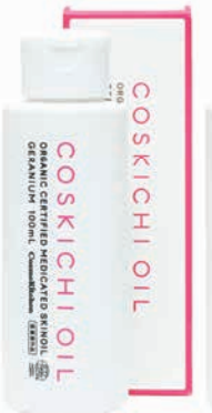
薬用オーガニック認証 スキンオイル