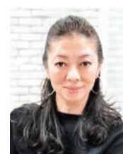
齋藤薫 美容ジャーナリスト／エッセイスト

当たり前の日常にも満足感を持ち、今持っているものを大切に、ささいなことにも喜びを感じる心をクセにしていこう……ヒュッゲこそがそのまま「いい」人を作るもっとも簡単なテクニック。だからすぐに気づくだろう。「いい人」になると、たちまち幸せになれるって。