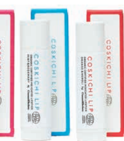
薬用オーガニック認証 リップスティック