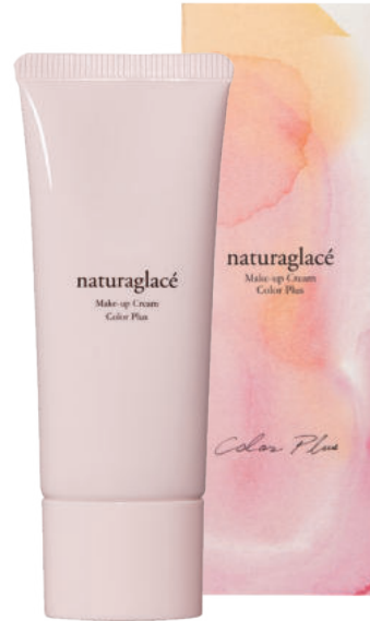
ラベンダーピンク くすみが気になる肌に。 透明感・血色感を演出

人気アイテム「メイクアップ クリーム カラープラス ラベンダーピンク」が 増量&スペシャルパッケージで限定発売