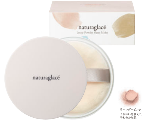
ラベンダーピンク うるおいを湛えた やわらかな肌

ブルーライト95.8%*カット 石けんでも落とせます* *第三者機関実証試験結果より