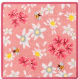
■コスメキッチンフローラルハンカチ ピンク(ピンクヘム) 2,750円(税込) 約25×25cm