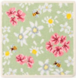
■コスメキッチンフローラルハンカチ グリーン(アイボリーヘム) 2,750円(税込) 約25×25cm