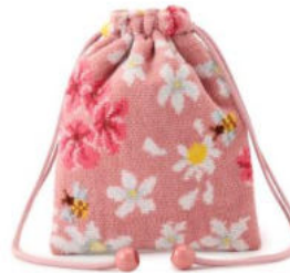
■コスメキッチンフローラル 巾着 6,050円(税込) 約18×14.5cm