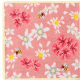
■コスメキッチンフローラルハンカチ ピンク(アイボリーヘム) 2,750円(税込) 約25×25cm