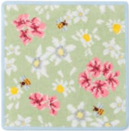
■コスメキッチンフローラルハンカチ グリーン(ブルーヘム) 2,750円(税込) 約25×25cm