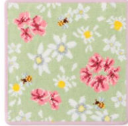
■コスメキッチンフローラルハンカチ グリーン(パープルヘム) 2,750円(税込) 約25×25cm