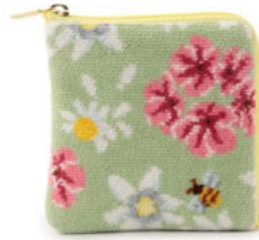
■コスメキッチンフローラル スクエアポーチ 6,600円(税込) 約13×13cm