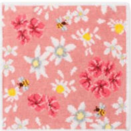
■コスメキッチンフローラルハンカチ ピンク(ホワイトヘム) 2,750円(税込) 約25×25cm