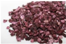
ムラサキ根エキス