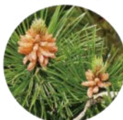
セイヨウアカマツ